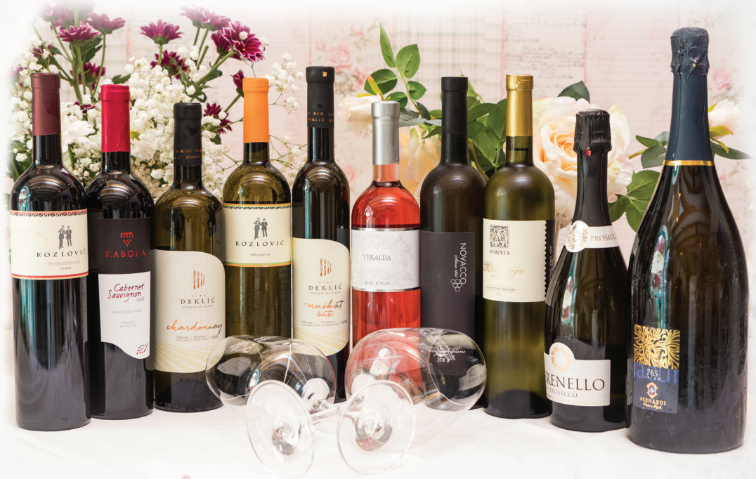
Vino Wine Wein Vino