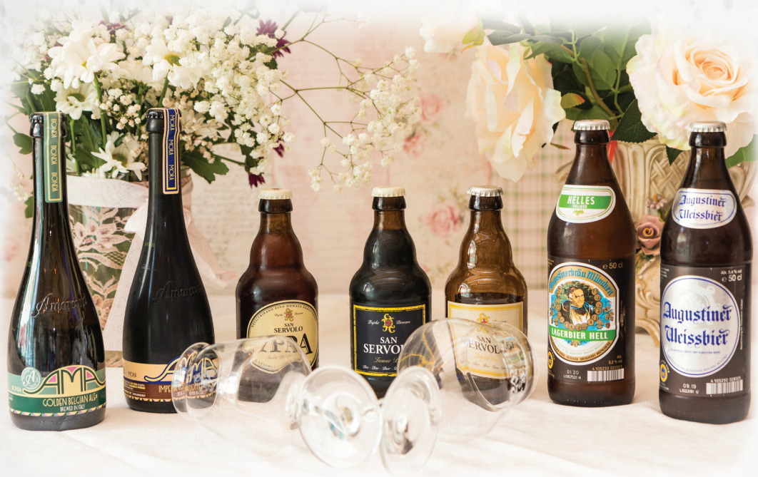
Pivo Beer Bier Birra